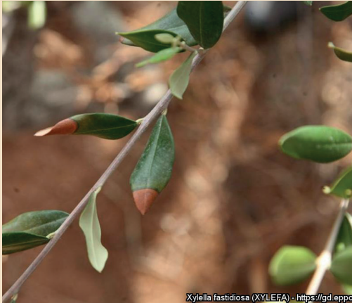
Xylella fastidiosa (XYLEFA) - https://gd.eppo.int