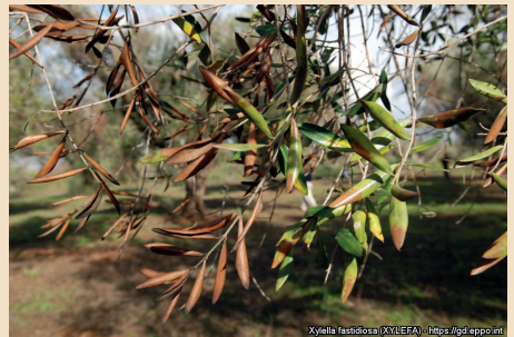
Xylella fastidiosa (XYLEFA) - https://gd.eppo.int