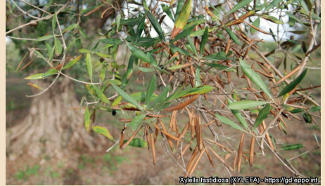
Xylella fastidiosa (XYLEFA) - https://gd.eppo.int