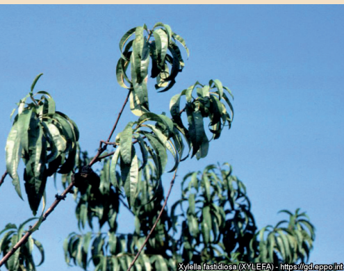
Xylella fastidiosa (XYLEFA) - https://gd.eppo.int

© Photos : source : gd.eppo.int (gauche) et Johnson et al. 2021 (droite)