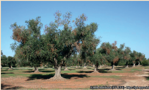
Xylella fastidiosa (XYLEFA) - https://gd.eppo.int